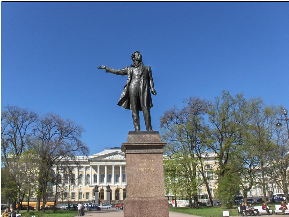
Pushkinstatyn i Konstparken, i bakgrunden Ryska museet

Lärkkulla folkakademi Skola nummer 555, St Petersburg